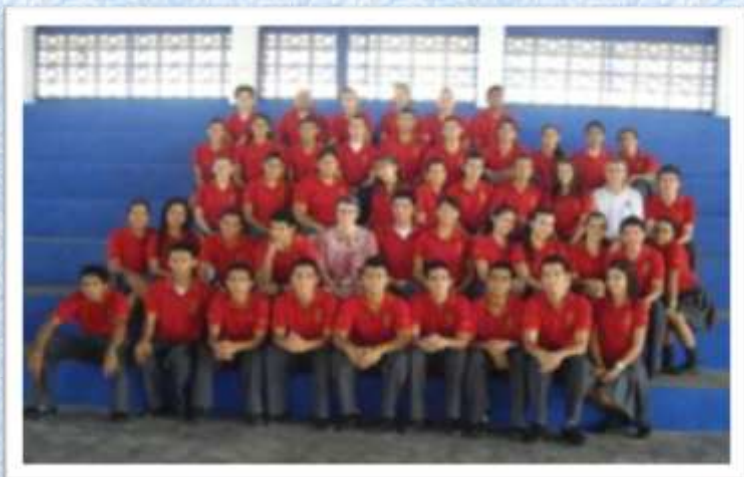
ALUMNOS DE UNDECIMO AÑO