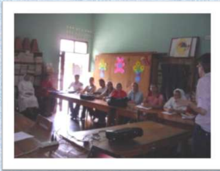
La Hna Inmaculada Compartiendo con el personal docente del Colegio.