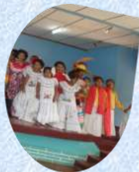
Derroche de color, música y energía