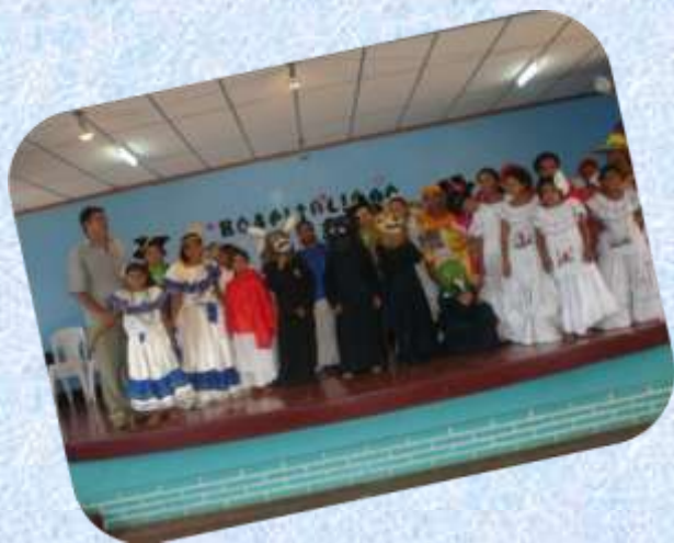
Así es nuestro pueblo