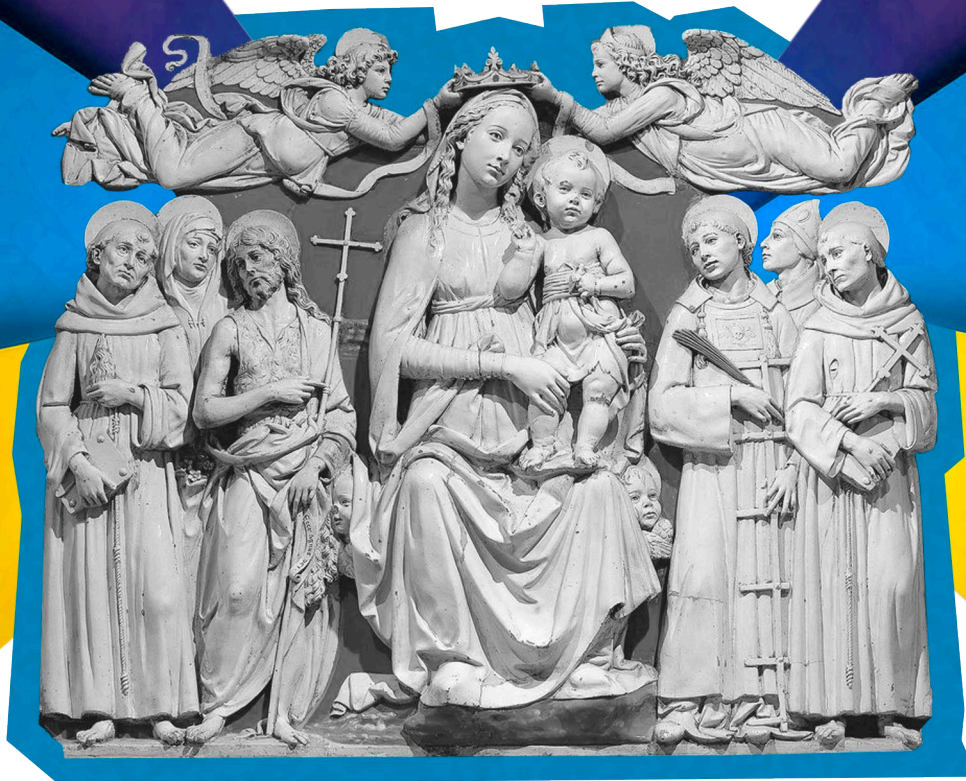
"Vierge à l'Enfant avec les saints" d'Andrea Della Robbia