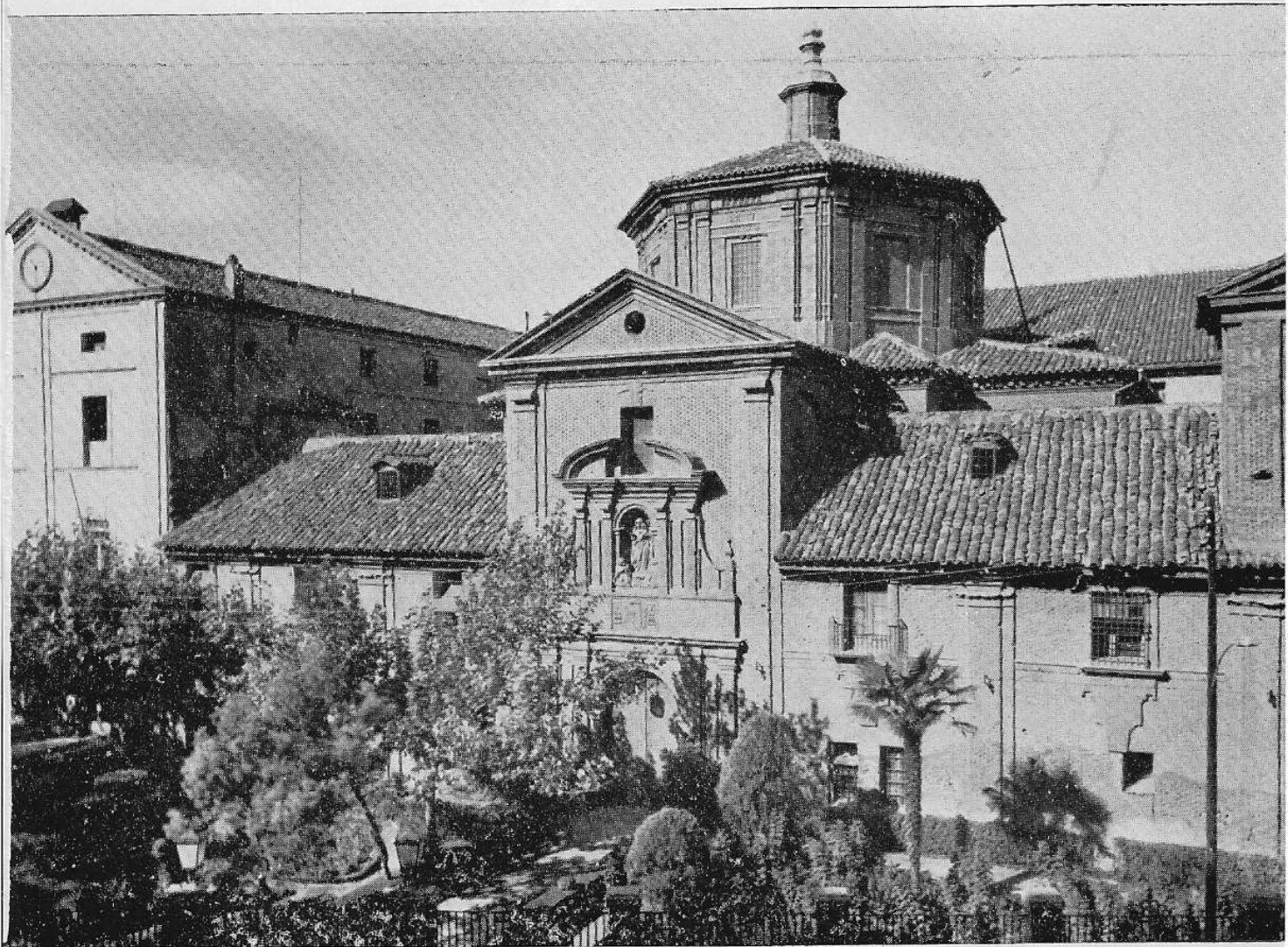
Edificio del Hospital de convalecientes en el que se instaló el Hospital de Ntra. Sra. de Gracia desde 1808 y en el que vivieron las Hermanas.