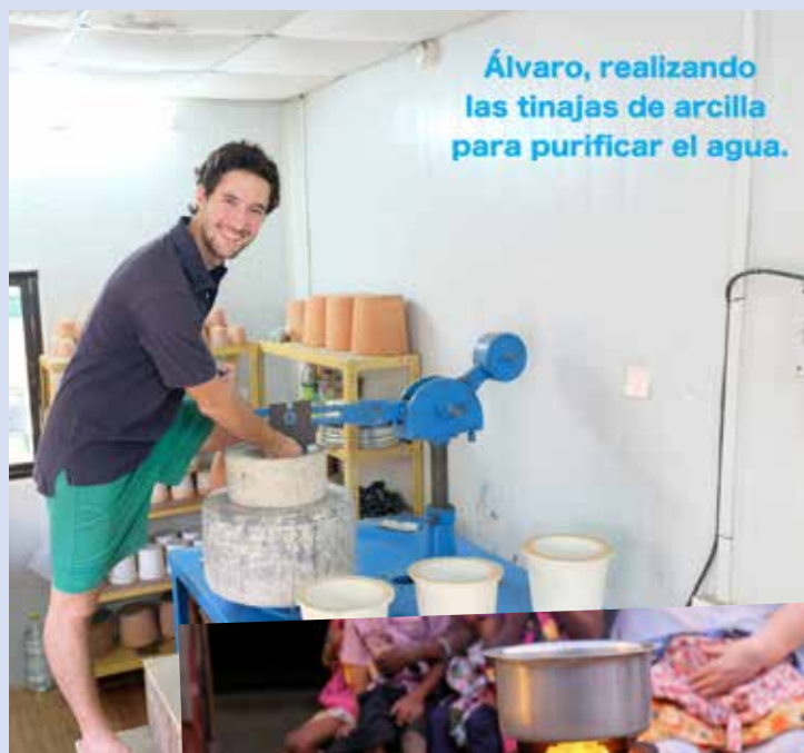
Primi Vela Goicoechea Hna. de la Caridad de Santa Ana

Deseamos que su testimonio y ejemplo, sirva de luz y ánimo a tantos jóvenes que buscan un sentido para su vida y que no saben el gran tesoro que llevan dentro.