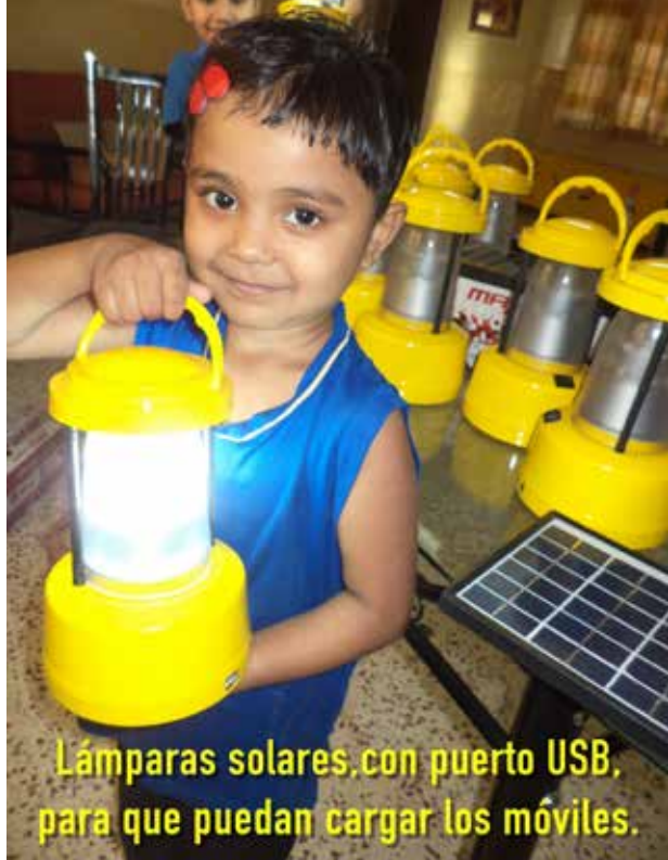
Lámparas solares con puerto USB, para que puedan cargar los móviles.

Mi relación con las Hermanas de la Caridad de Santa Ana viene de hace bastantes años, cuando, siendo niño, ayudaba a mi padre en los apadrinamientos de niños de la India. Gracias a las Hermanas pude venir a la India hace 7 meses para construir una mini fábrica donde producir filtros de cerámica para potabilizar agua. Desde entonces estoy viviendo con ellas en Ankur Hogar de niñas, donde las Hermanas además de acoger, cuidar y escolarizar a 200 niñas de las chabolas y de la calle, se encargan de alimentar a más de 600 familias y de proveer de los cuidados médicos necesarios, también de forma gratuita, a la gente más pobre de los barrios de chabolas de la ciudad con un Dispensario móvil que las recorre cada día.