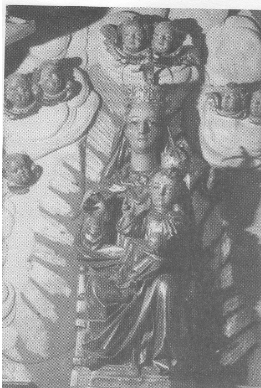
Borja y alrededores

D e ninguna manera puede hablarse de la ciudad de Borja y sus alrededores sin subir a su famoso santuario de Misericordia, situado cerca de una legua de distancia en dirección a EL Buste, en la falda de la Muela Alta, a una altura de 785 metros sobre el nivel del mar.