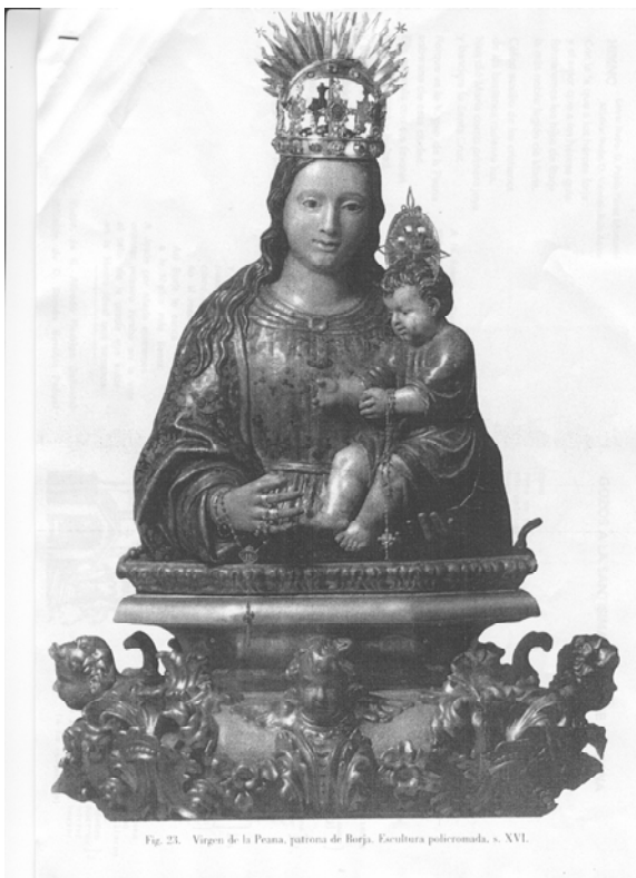
Fig. 23. Virgen de la Peana, patrona de Borja. Escultura policromada, s. XVI.