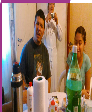
Reunión en Complejo La Perlita—Moreno, amena y alegre

El amor es invisible. Sólo lo podemos ver en los gestos, los signos y la entrega de quien nos quiere bien. Por eso, en Jesús crucificado, en su vida entregada hasta la muerte, podemos percibir el amor insondable de Dios.