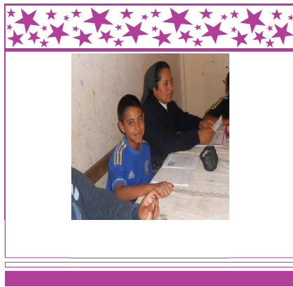
Imagen tomada en 2014